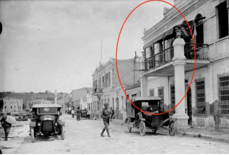
(Kala-i Sultaniye Hükümet Konağı 1919 Yılından Görünümü 87 )