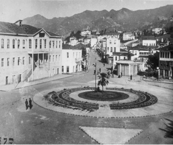
Rize kent meydanındaki Hükümet Konağı.